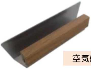
空気調整プレート